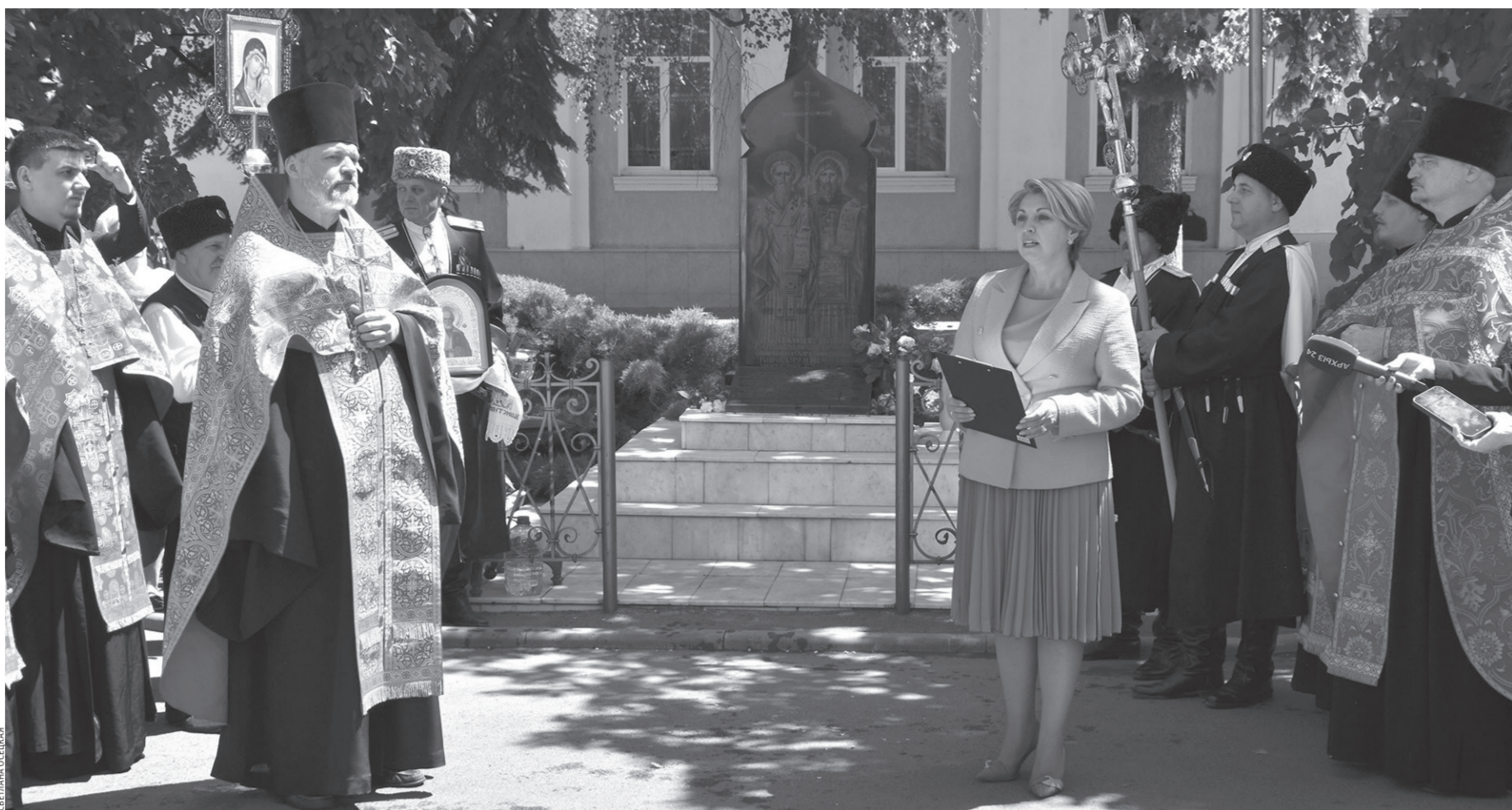
Митинг возле памятника равноапостольным братьям Кириллу и Мефодию

В этот праздник, приуроченный ко дню памяти святых равноапостольных братьев Мефодия и Кирилла, ученых и просветителей, создавших славянское письмо, в Черкесске состоялся традиционный крестный ход, который прошёл от Никольского собора до памятника святым просветителям на центральной площади республиканской столицы. Участие в праздничном молебне и шествии приняли духовенство, казаки, прихожане храмов города.