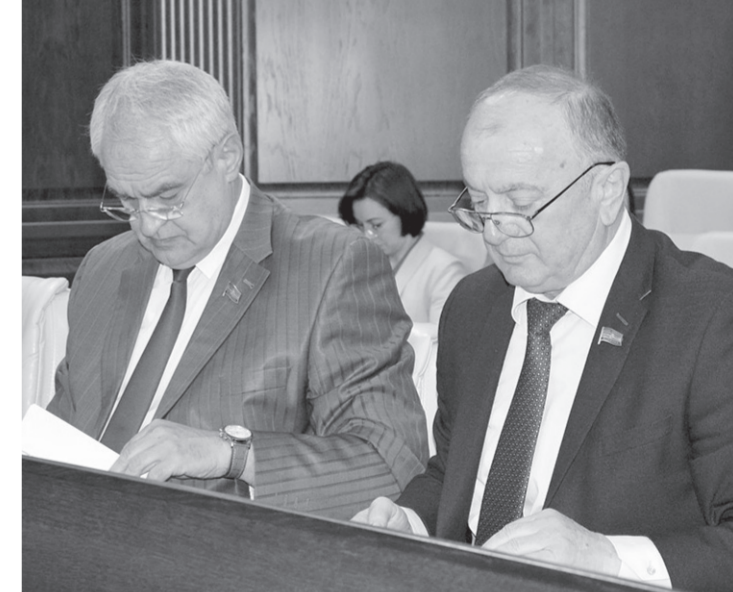
Депутаты Парламента КЧР обсуждают новые законопроекты

Внесены изменения в статью 9 Закона КЧР «О некоторых вопросах оказания бесплатной юридической помощи в Карачаево-Черкесской Республике». Проект закона разработан на основании поручения Главы КЧР, в соответствии с ним расширен список граждан на получение бесплатной юридической помощи в республике. Добавлены следующие категории: непосредственные участники испытаний ядерного оружия в атмосфере, боевых радиоактивных веществ и учений с применением такого оружия до даты фактического прекращения таких испытаний и учений; непосредственные участники подземных испытаний ядерного оружия в условиях нештатных радиационных ситуаций и действия других поражающих факторов ядерного оружия; непосредственные участники ликвидации радиационных аварий на ядерных установках надводных и подводных кораблей и других военных объектах; личный состав отдельных подразделений по сборке ядерных зарядов из числа военнослужащих; непосредственные участники подвозных испытаний ядерного оружия, проведения и обеспечения работ по сбору и захоронению радиоактивных веществ.