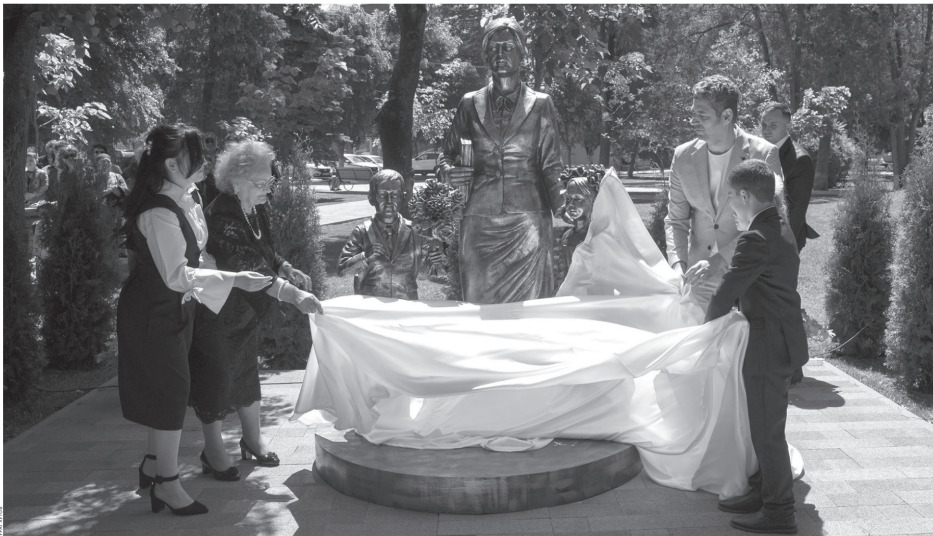
Торжественный момент открытия скульптурной композиции «Мой первый учитель»

«Рад быть участником такого светлого мероприятия: первый учитель — очень важный человек в жизни каждого. Он оказывает огромное влияние на формирование личности, гражданина, патриота, его базовых знаний, культурного кода, а главное — дает ребенку настрой на учебу, на активное движение вперед по жизни. Скульптура подчеркивает значимость педагогического труда и станет украшением столицы нашей республики», — добавил Казбек Коков.